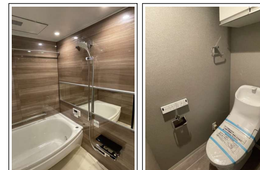
※室内写真は当社施工例