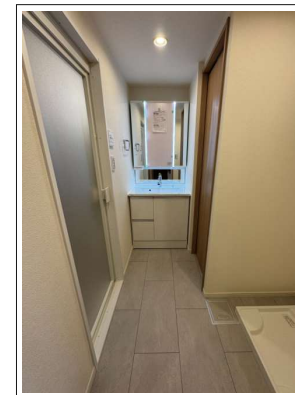
※室内写真は当社施工例