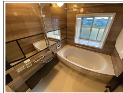
※内装写真は施工例です。