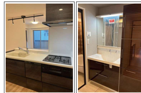
※室内写真は施工例