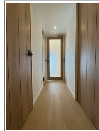
※室内写真は当社施工例