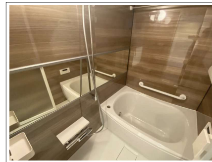
※室内写真は当社施工例