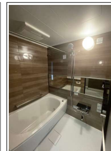
※室内写真は当社施工例