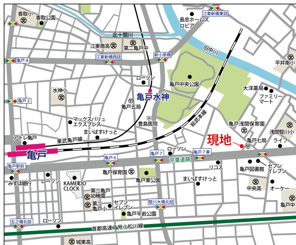
ライフインフォメーション