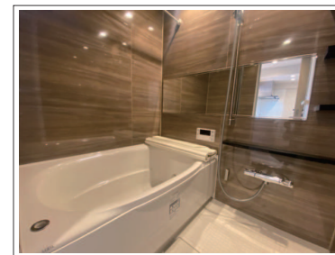
※室内写真は当社施工例