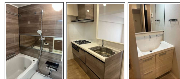
※室内写真は当社施工例