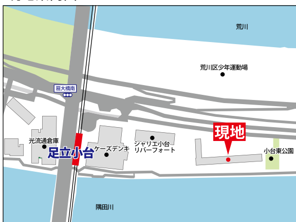
ライフインフォメーション