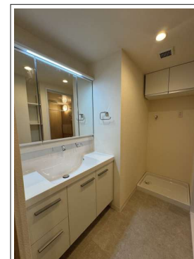
※室内写真は当社施工例