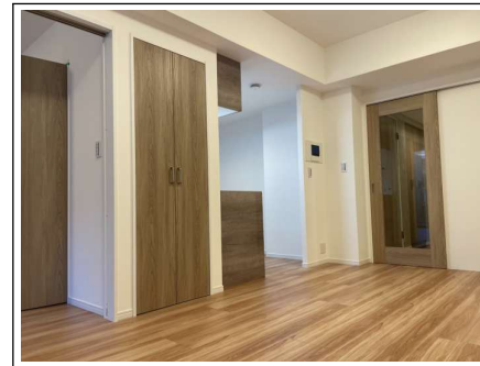
※室内写真は施工例です。