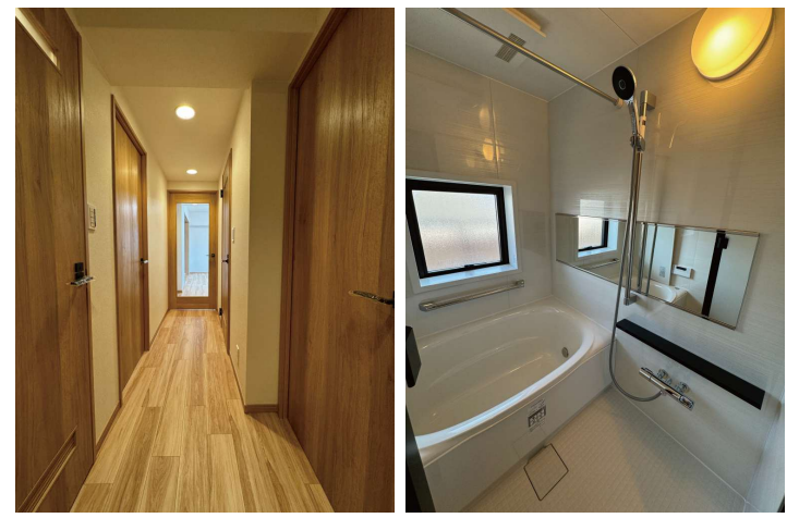
※室内写真は当社施工例