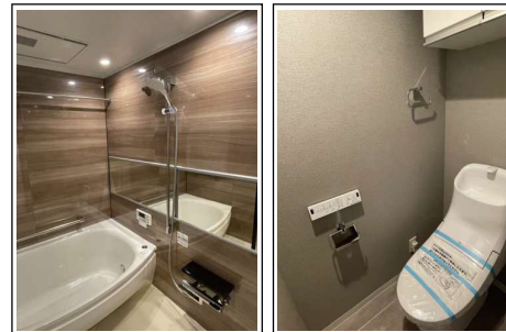
※内装写真は施工例です。